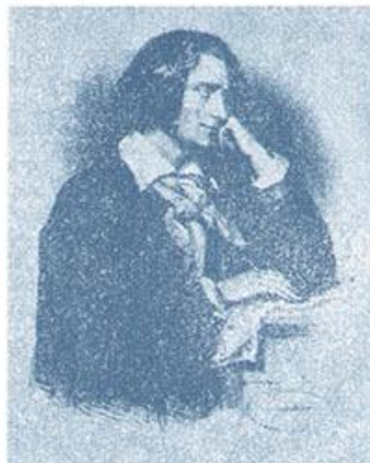
Kriehuber, Josef: Franz Liszt, 1850

Anlässlich seines Konzertes im Jahre 1846 wurde Liszt von Komitat Sopron beehrt, er wurde zum Tafelrichter des